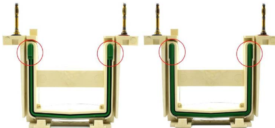
图 1. Bio-Rad 公司的 Mini-PROTEAN® Tetra Cell 电泳槽 U 型硅橡胶密封条的突起结构图。由于闪晶生物的 ShineGel™ Plus PAGE 预制胶的该部位是平的, 使其兼容几乎所有厂家的小型胶电泳槽, 所以电泳时须将具有突起结构的硅橡胶密封条(左图)取出后反过来安装(右图), 使其没有突起的平滑面朝外, 从而防止漏液。

> 本预制胶为了兼容几乎所有厂家的小型凝胶电泳槽, 所以改进了与电泳槽 U 型硅橡胶密封条的吻合结构(如 Bio-Rad 公司的 Mini-PROTEAN® Tetra Cell 电泳槽)。建议在电泳时须将具有突起结构的 U 型硅橡胶密封条取出后反过来安装, 使其没有突起的平滑面朝外, 从而防止漏液, 见下图。一般内槽电泳液加满, 外槽电泳液没过电泳槽底部的阳极即可, 并且电泳结束后的电泳缓冲液可以作为外槽缓冲液重复使用 1-2 次。另外, 部分公司都已经配套无突起结构的 U 型硅橡胶密封条, 使用这样的 U 型硅橡胶密封条就不会出现内外槽之间的漏液现象。